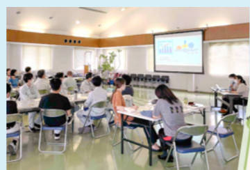
健康セミナーの申し込み受付中!

▲血圧ポスター まずはご自身の血圧をきっかけに、健康に興味を持ってみませんか。2次元コードで生活習慣の改善ポイントまでご案内しています。