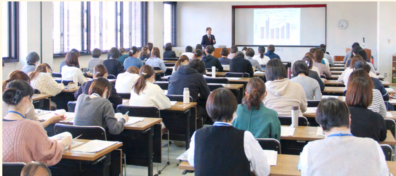
研修中は「一言も聞き漏らすまい」と真剣

令和5年12月1日(金)、当協会において 高知県内の特定保健指導に関わる方を対象に研修会を開催しました。