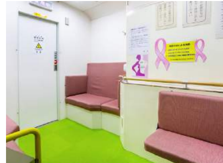
更衣スペースを兼ねた待合室

それぞれバス内に更衣室を兼ねた待合があり、女性が安心できる空間を心がけています。