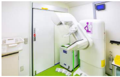
マンモグラフィ撮影室

高知県総合保健協会には、マンモグラフィ検診車や、子宮がん検診車などの婦人がん検診車が合わせて5台あり、施設まで検診に來られない方などにも受診が可能となっています。 マンモグラフィの装置は、デジタル処理により乳房内を適正な画質で表示させ、診断に適した画像を得ることができ、小さな乳がんなども見つけることができます。 子宮がん検診車では、子宮頸がんを早期に見つけるための検診を実施しています。